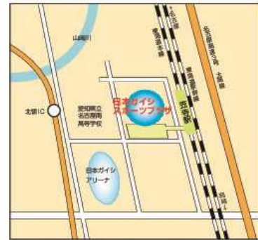
名古屋駅より JR東海道本線 (岡崎・豊橋方面) 約11分 笠寺駅より徒歩3分